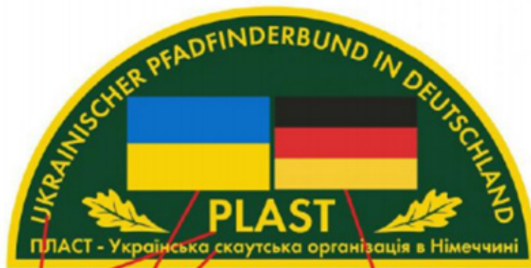
Офіційна назва організації в країні згідно реєстрації в країні (мовою країни) Назва організації українською мовою Державний прапор України Державний прапор краю