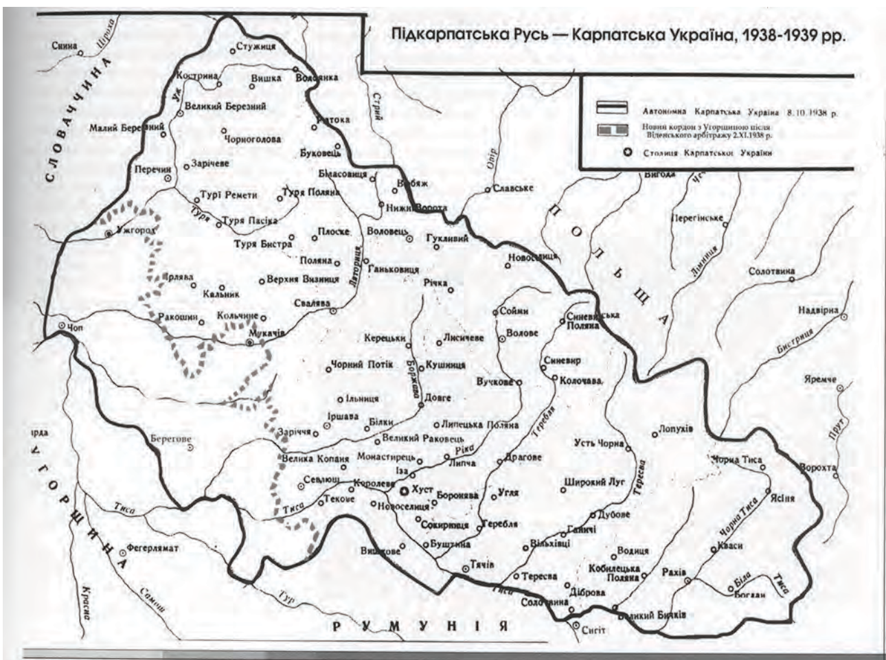
Мапа Карпатської України, 1938-1939 рр

Вирішальною подією, що переконала Чемберлейна у перфідності Гітлера, було не так загарбання Праги, але згода Німеччини на окупацію Карпатської України Мадярщиною. Це рішення привело амбасадора Франції Роберта Кулондра в Берліні звітувати Бонетові, що після всякої правдоподібності «Райх перед тим, ніж здійснить свою велику програму на Сході, наперед звернеться проти західних великих держав». Кожний, хто читав «Майн Кампф», повинен знати, що нацистська стратегія має намір знищити Францію перед тим, а не після того, як спробує здобути Росію.