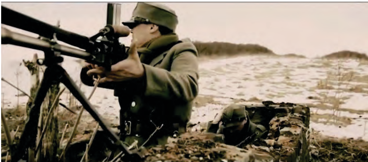
Кадр з фільму Срібна Земля, 2012, режисер Тарас Химич

Більшість оборонців з Красного Поля відступила, щоб зайняти кращі позиції перед самим Хустом.