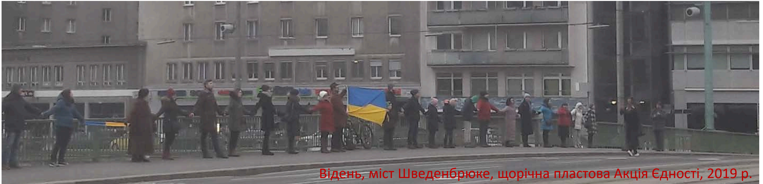
Відень, міст Шведенбрюке, щорічна пластова Акція Єдності, 2019 р.

пластуни долають кордони, єднають Пласт і Україну